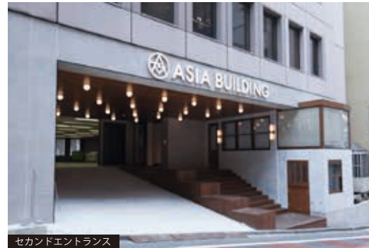
セカンドエントランス