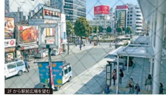
2Fから駅前広場を望む

通信設備 光ファイバー引込済 (MDFまで) 昇降設備 エレベーター1基 (11人乗) 電気容量 動力：100A×2、電灯：50A×2 防災設備 自動火災報知設備、屋内消火栓 避難誘導灯設備、非常照明 他 防犯設備 機械警備 (ALSOK) 天井高 2,400mm (※階高：3,400mm) 床荷重 300kg/㎡ ガス設備 25A×2 給水設備 30A×2 排水設備 100A×4 引渡状態 スケルトン