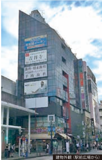
建物外観（駅前広場から）