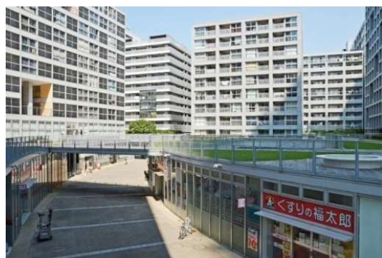
1街区から3街区方面