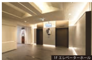
1F エレベーターホール