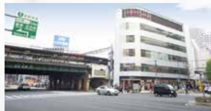
JR五反田駅と桜田通り

JR山手線五反田駅 西口 徒歩2分・都営浅草線五反田駅 A1出口 徒歩1分、ビルの前は桜田通り(国道1号線)が走り、首都高速出入口(首都高速2号目黒線/荏原・戸越)も近く、自動車での移動にも便利です。さらに近隣には主要都市銀行の支店や郵便局などがあり、まさにビジネスに最適なロケーションとなっています。