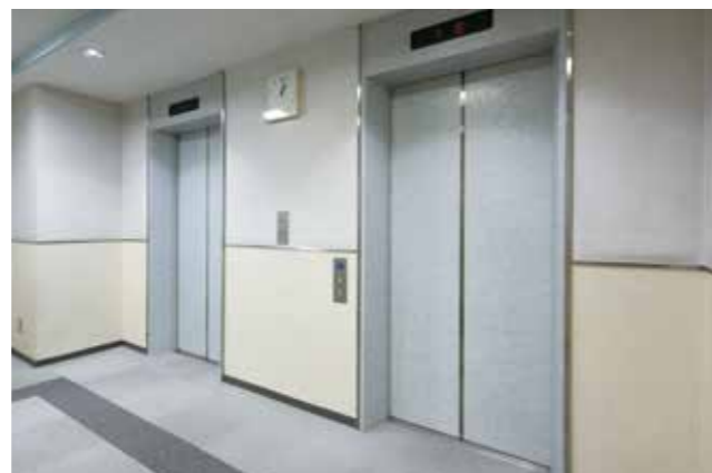
9階エレベーターホール