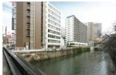
目黒川とビル外観