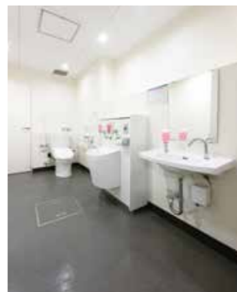
だれでもトイレ(車椅子対応)