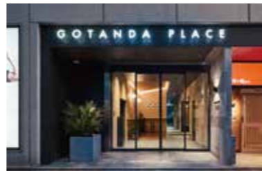
エントランス外観