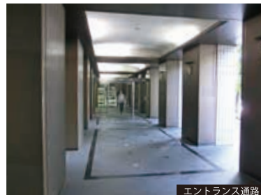
エントランス通路